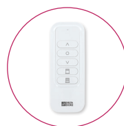
Émetteur Portatif X3D Commande un ou plusieurs volets