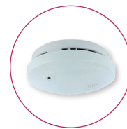
Détecteur de fumée Ouvre les volets en cas de détection de fumée