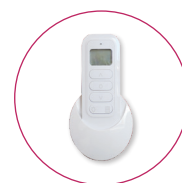
Émetteur Portatif 16 Canaux X3D permet un retour d'information