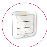
Émetteur Mural X3D Commande un volet