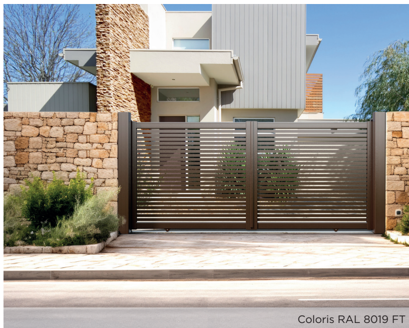
Coloris RAL 8019 FT