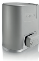
Elixo Smart Io pack confort

Pour portails coulissants dont la longueur du vantail n'excède pas 6000 mm et 300 kg.