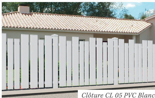
Clôture CL 05 PVC Blanc