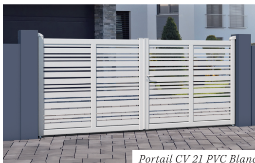
Portail CV 21 PVC Blanc