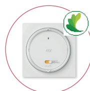
Amy Sun Protect Avec capteur de température intelligent.