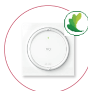
Amy 1 IO