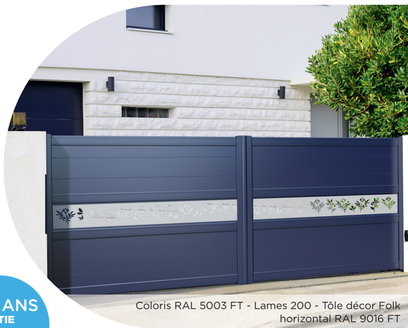
Coloris RAL 5003 FT - Lames 200 - Tôle décor Folk horizontal RAL 9016 FT