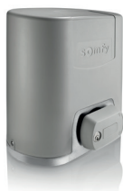
Elixo Smart Io pack confort

Pour portails coulissants dont la longueur du vantail n'excède pas 6000 mm et 300 kg.