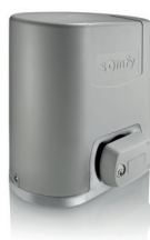
Elixo Smart Io pack confort

Pour portails coulissants dont la longueur du vantail n'excède pas 6000 mm et 300 kg.