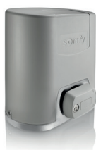
Elixo Smart Io pack confort

Pour portails coulissants dont la longueur du vantail n'excède pas 6000 mm et 300 kg.