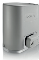
Elixo Smart Io pack confort

Pour portails coulissants dont la longueur du vantail n'excède pas 6000 mm et 300 kg.