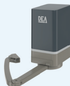
Geko / X

Pour portails battants n'excédant pas 5000 mm entre piliers. (écoinçon mini 600 mm)