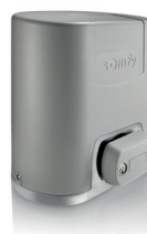
Elixo Smart Io pack confort

Pour portails battants dont la longueur d'un vantail n'excède pas 2000 mm et 300 kg.