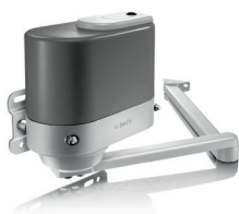
Axovia Multipro 3S Io pack confort

Pour portails battants dont la longueur d'un vantail n'excède pas 2000 mm et 300 kg.