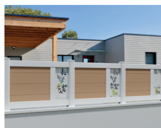
CL 25 T