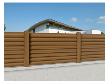
CL 13 C