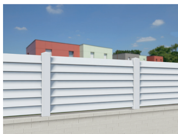
CL 13 A