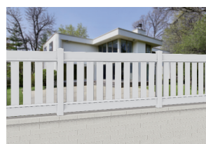
CL 10 B