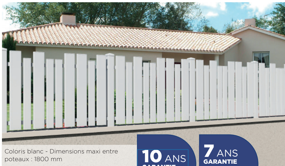
Coloris blanc - Dimensions maxi entre poteaux : 1800 mm