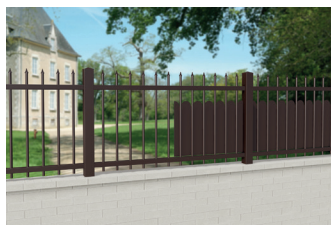
CL CS 01