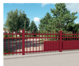
CL CS 03