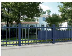
CL CS 02

Avec anneaux Ø 100 mm, tôle droite ou festonnée.